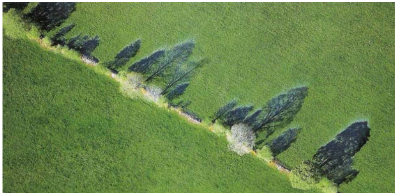
Ombres givrées ©Gérard Benoit à la Guillaume

Toutes nos illustrations sont disponibles sur demande