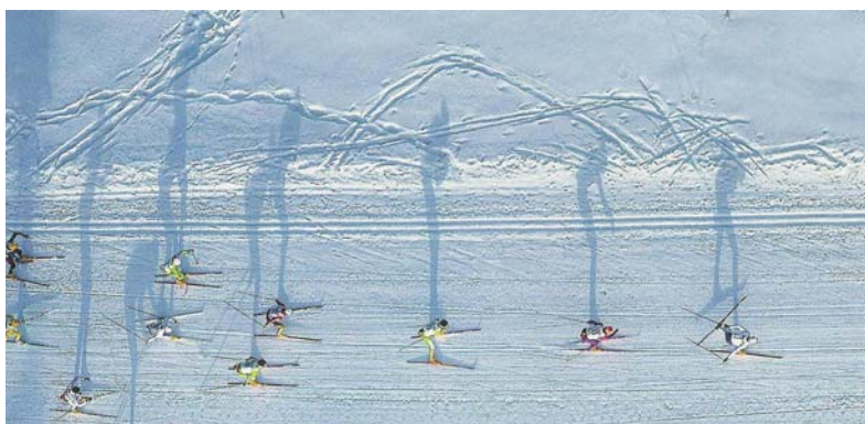
La Transjurassienne