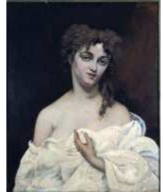
Courbet - Portrait de femme musée national d'art occidental de Tokyo