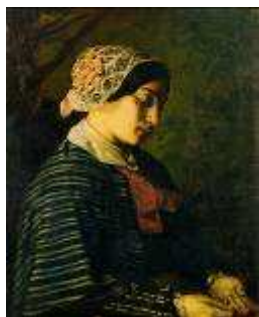
Gustave Courbet Portrait présumé d'une jeune fille d'Ornans 1842, musée Courbet

Les œuvres accompagnées d'archives et de photographies retracent le contexte politique et artistique de l'époque. Elles permettent une réelle et vivante compréhension du milieu auquel appartenait Courbet et de l'influence que l'artiste eut sur l'art de son temps.