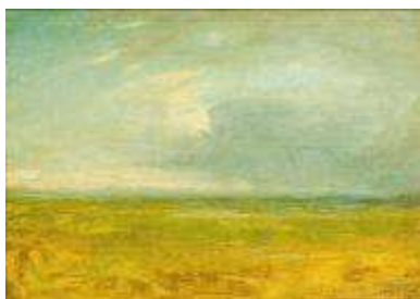
Gustave Courbet La plage de Trouville - Vers 1865 musée Courbet